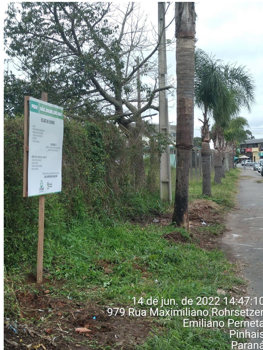
14 de jun. de 2022 14:47:10 979 Rua Maximiliano Rohrsetzer Emiliano Pernetá Pinhais Paraná