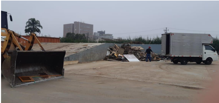
Ecoponto em uso - 20 de julho de 2022.