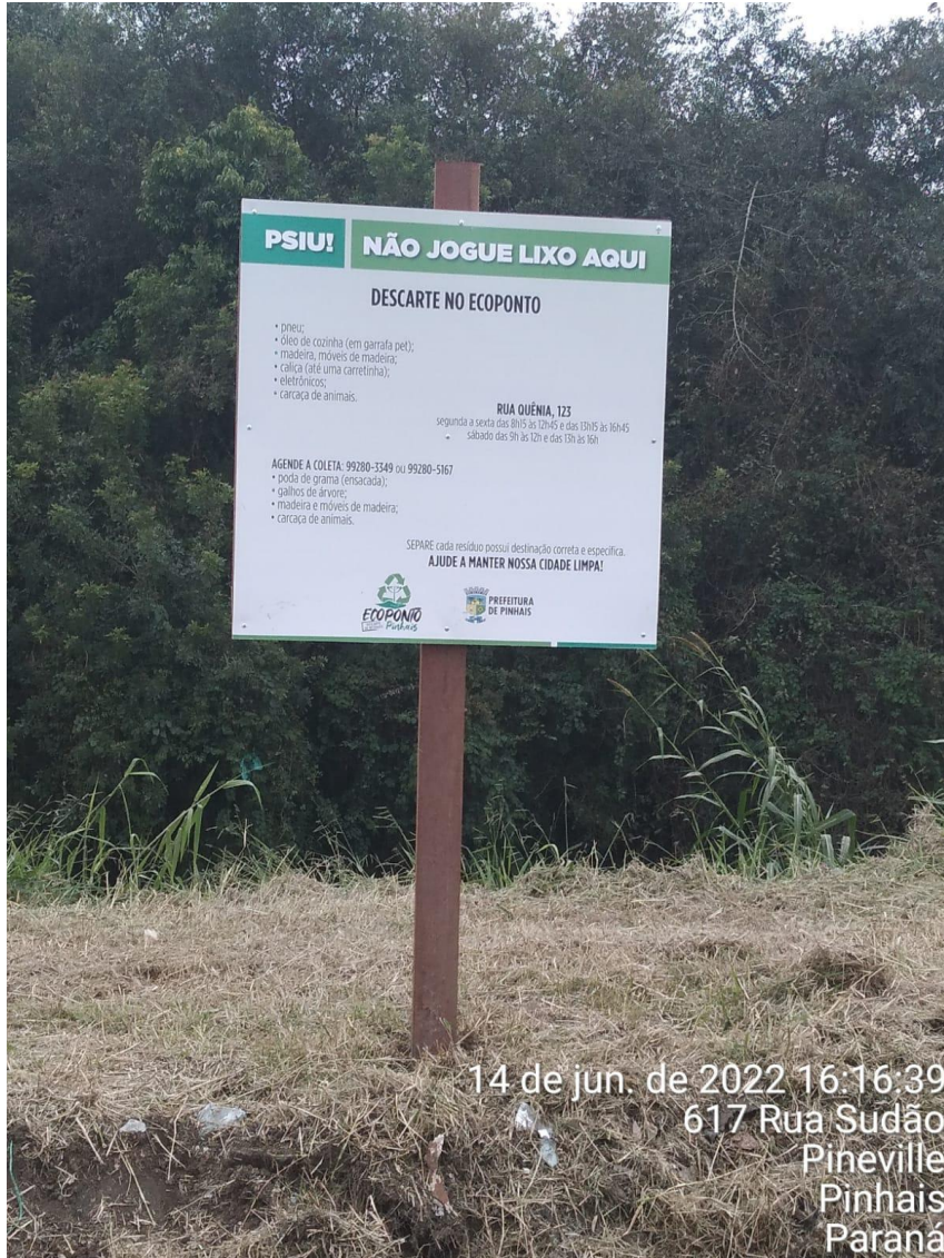
14 de jun. de 2022 16:16:39 617 Rua Sudão Pineville Pinhais Paraná