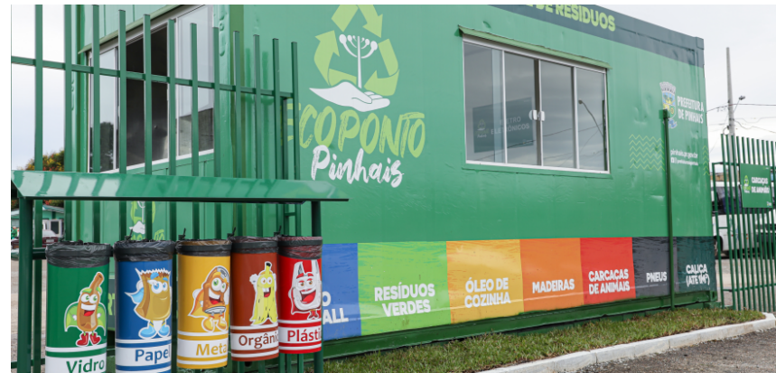
Container administrativo e lixeiras para outros recicláveis de menor volume - 25 de março de 2022.