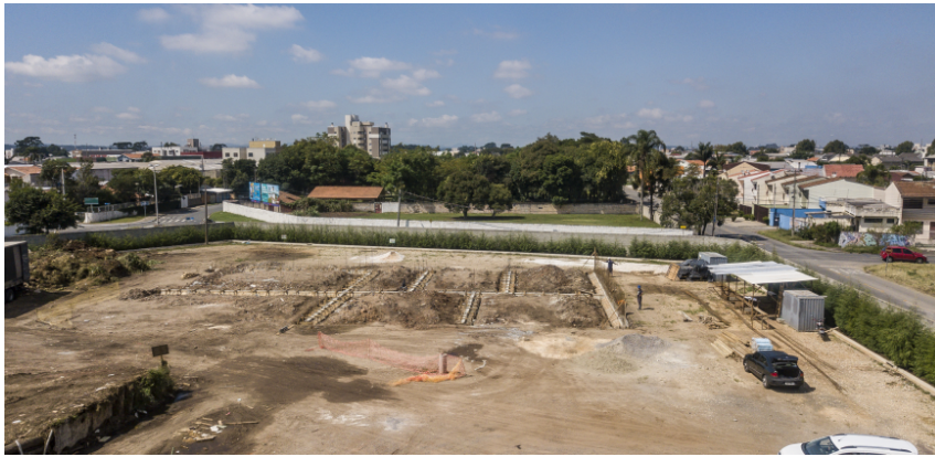
Início da construção das baias - 17 de junho de 2021.