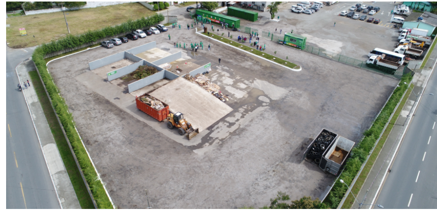
Inauguração - 25 de março de 2022.