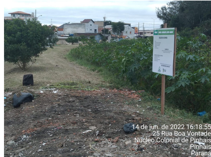
14 de jun. de 2022 16:18:55 25 Rua Boa Vontade Núcleo Colonial de Pinhais Pinhais Paraná