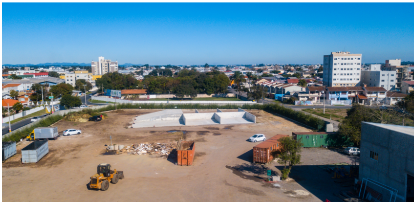
Baias erigidas - 23 de junho de 2021.