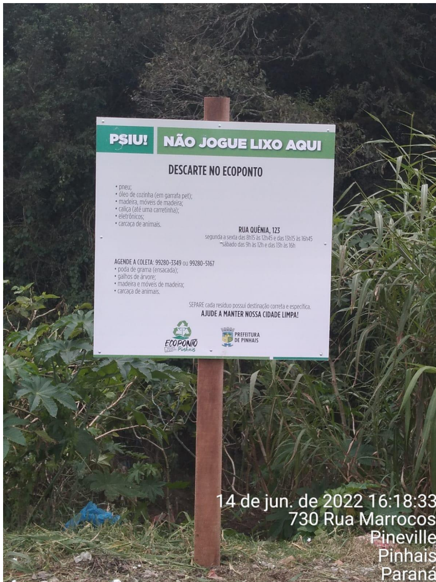
14 de jun. de 2022 16:18:33 730 Rua Marrocos Pineville Pinhais Paraná