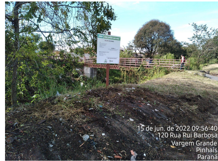
15 de jun. de 2022 09:56:40 120 Rua Rui Barbosa Vargem Grande Pinhais Paraná